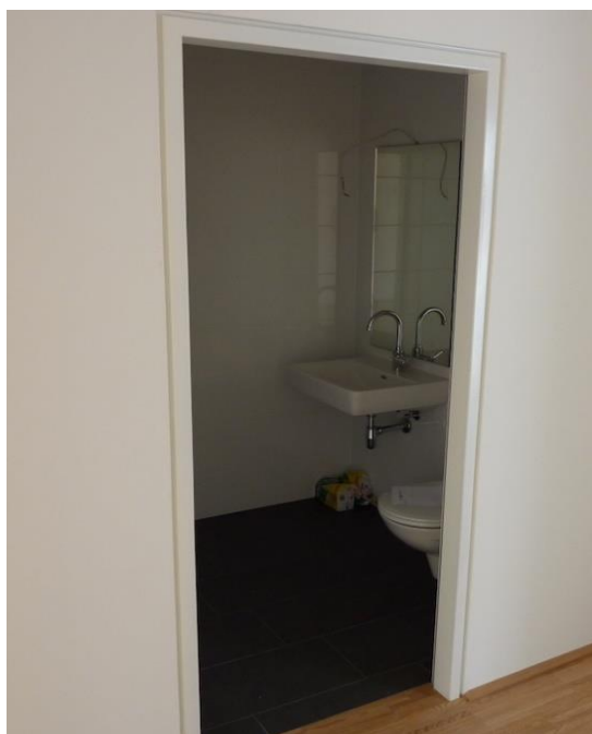
Blick ins Badezimmer