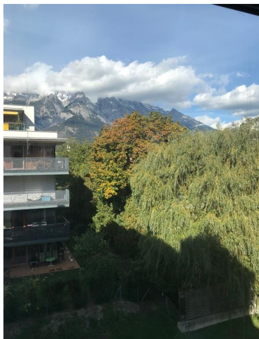
Blick vom Fahrstuhl nach Norden