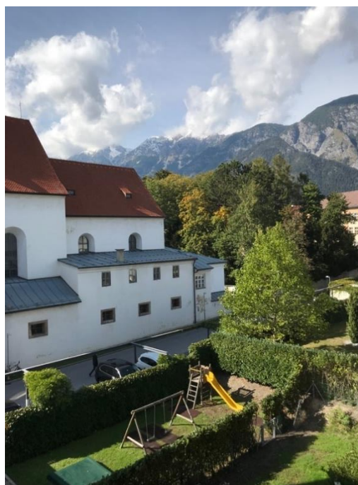
Blick vom Wohnungseingang nach Nord-West