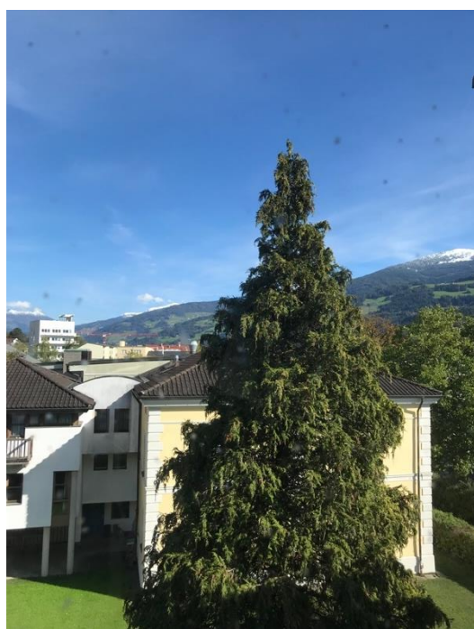
Blick vom Fahrstuhl nach Osten