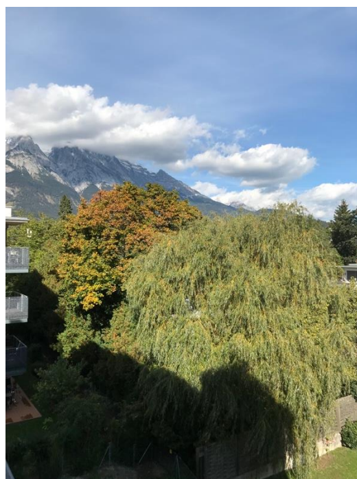
Blick vom Treppenhaus nach Norden